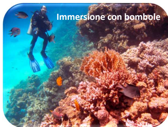
Immersione con bombole