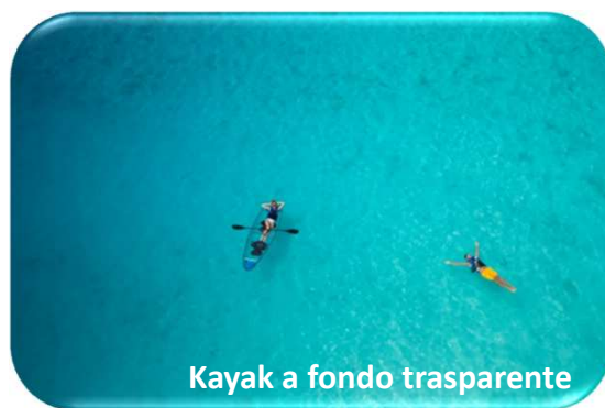
Kayak a fondo trasparente