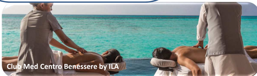
Club Med Centro Benessere by ILA